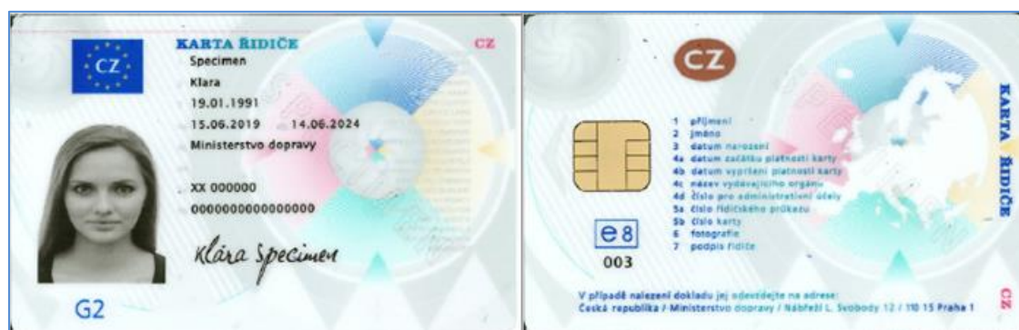
Obrázek 1 - Karta řidiče